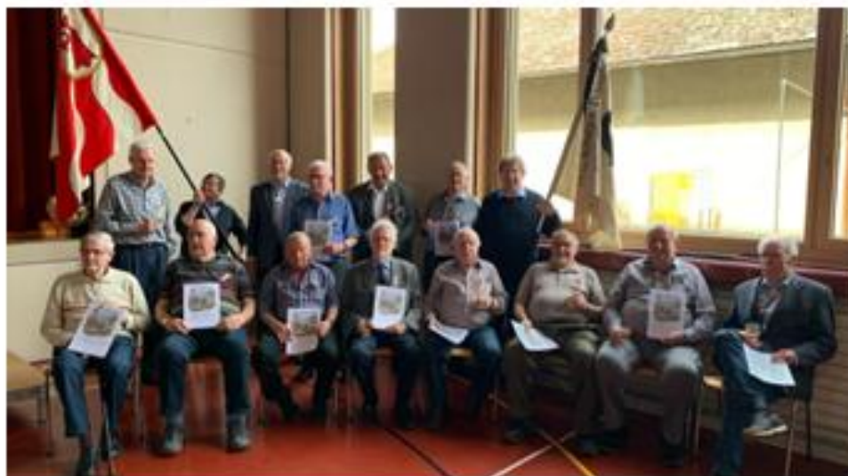
Die neuen anwesenden Ehrenveteranen